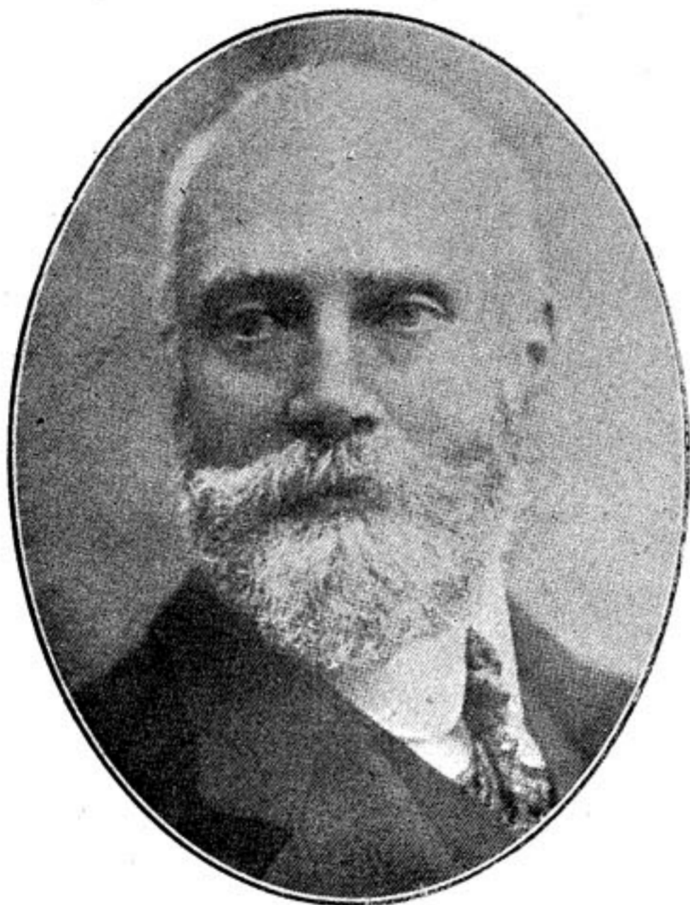
D. Armando Palacio Valdés, Príncipe de las Letras Hispanas.

dón como en la ocasión presente, pues con ello se realizaría un verdadero acto de justicia enaltecedor tanto para los que lo demandan como para los que lo otorgaran y un gran honor para las propias letras españolas; sería rendir homenaje debido — aunque bien retrasado por cierto — al ilustre autor de “La Hermana San Sulpicio”, de “La Aldea Perdida”, de “Riverita y Maximina”, de “Santa Rogelia” (ésta su última y magistral producción) y de tantas otras obras — cuya riqueza literaria se ha expandido por todo el mundo — y han alcanzado el honor de ser las más traducidas.