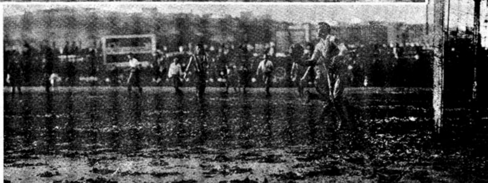
Magnífica defensa de Amador al ataque del “Real Madrid”.