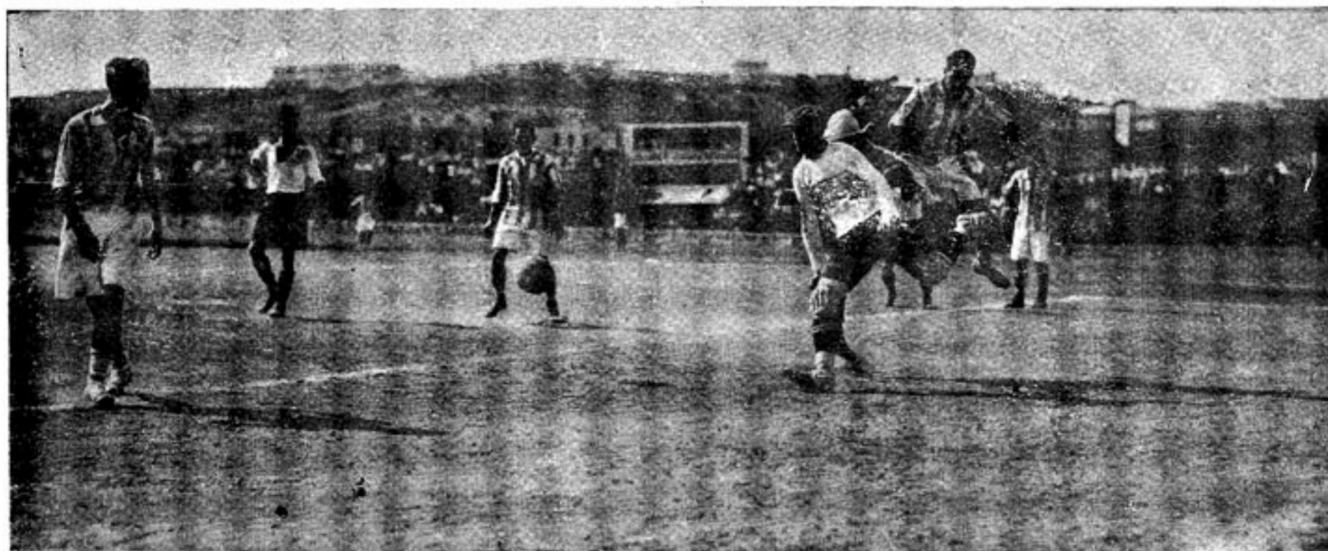
Interesante momento del partido “Real Madrid” y “La Juventud Asturiana”