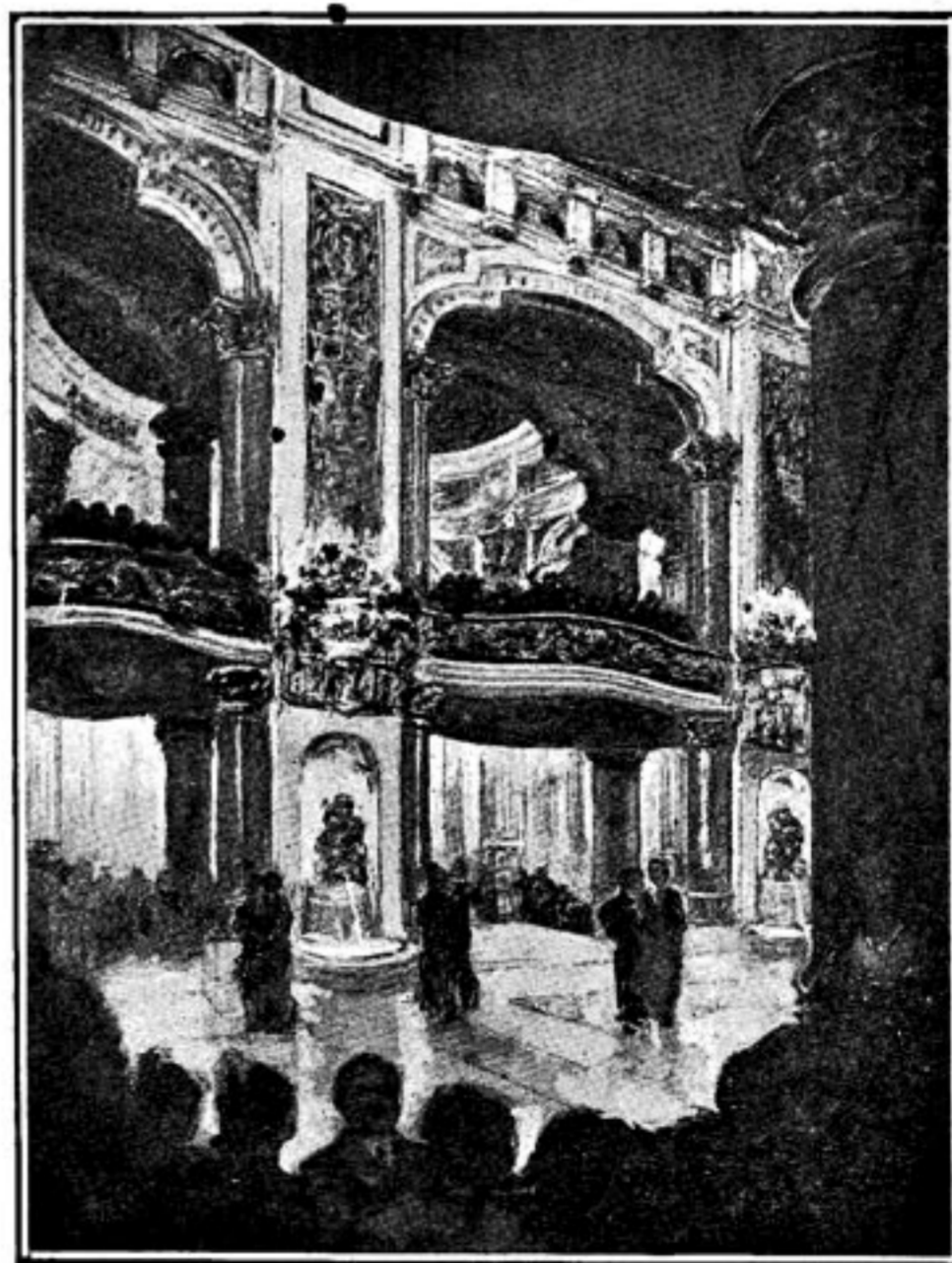
Precioso aspecto del Gran Salón de Fiestas que causará sensacional admiración.

Todas las piezas que forman la estructura de ace-