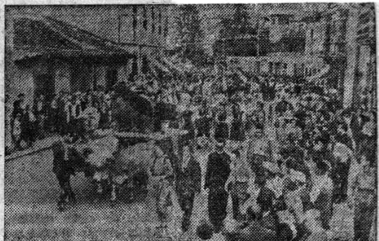
Otro aspecto del desfile por la villa de la meta de salida

Total de piraguas clasificadas, cuarenta.