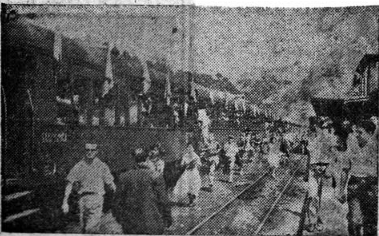
¡Al tren, señores viajeros!